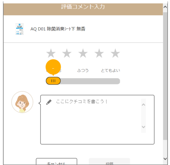
図 2 コメント入力 画面イメージ

オートバックスグループで購入した商品の画像やコメントを投稿できるのは、eBASE に格納されている商品マスタに商品コンテンツ情報（商品画像 ii や詳細情報）が登録されている場合のみに限られます。